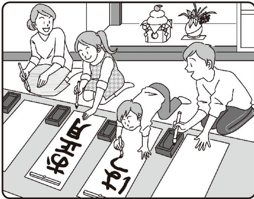
色を塗って遊んでね！

「書き初め」 明けましておめでとう ございます。本年も、 よろしくお願ひします。 初夢はいかがでしたか？ 今日は、家族揃って、 書き初めをしています。 姿勢をきちんとただし、 みんな真剣そのもの。 一年の想いを込め懸命 に書いています。門松