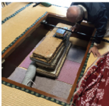
1尺 = 30.3cm