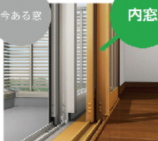
防音断熱/内窓 インプラス