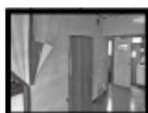
Before 玄関・廊下・脱衣室・勝手口