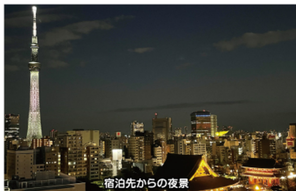
宿泊先からの夜景

今回のように何処でどんな出会いがあるのか、思いがけない出会いがあるものだなあと、改めて思いました。