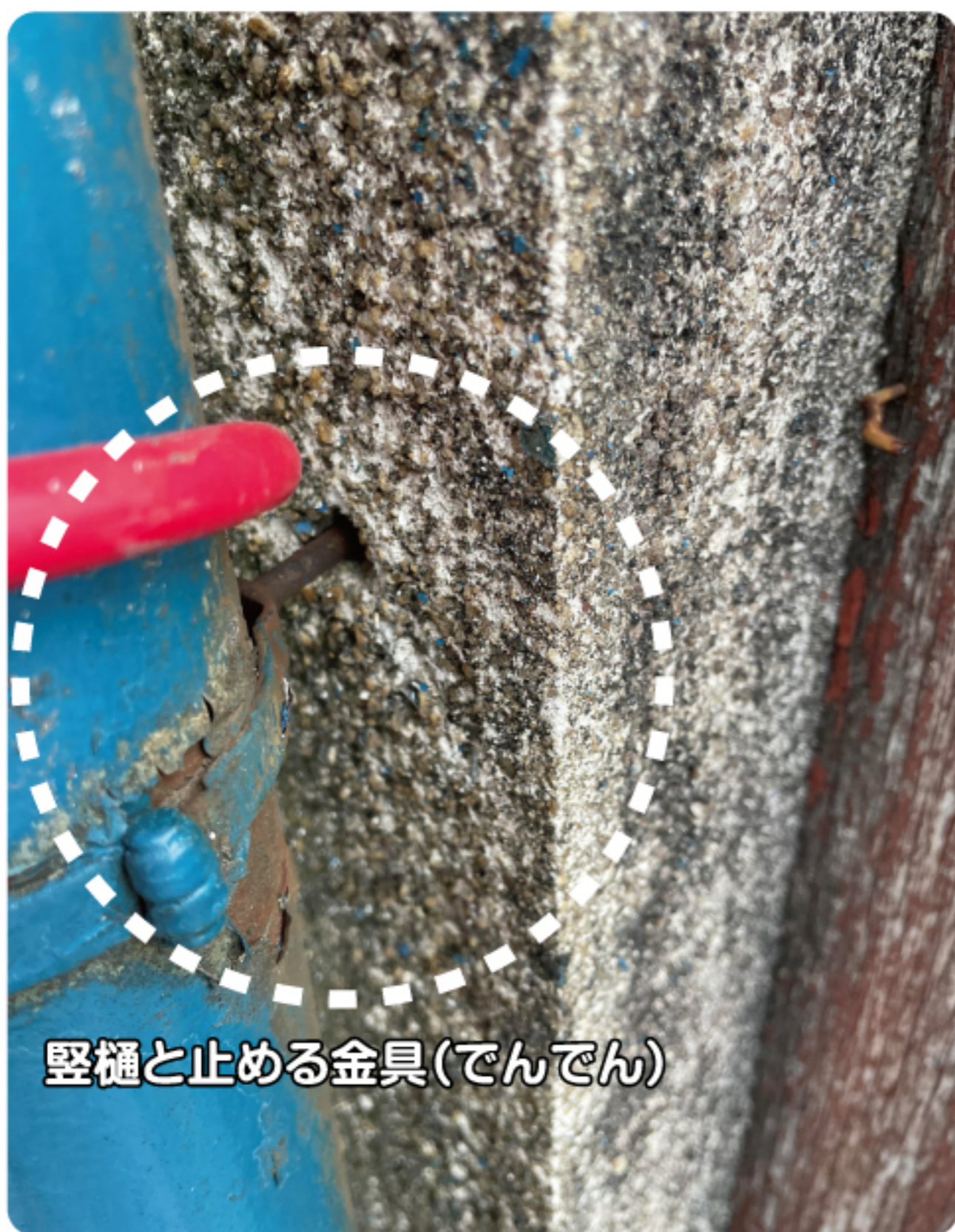
縦樋と止める金具(でんでん)