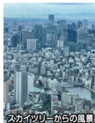
スカイツリーからの風景

昨年末、子供が行きたがっていたイベントに参加するついでに家族旅行、浅草に宿泊しました。夕食を取る為近隣を散策していましたが、このご時世なので、席数、客数を確認の上、個人営業のお寿司屋さんに入りました。カウンター席で江戸前寿司とアルコールを楽しみながら大将と会話をしていると、自分達が何処から来たのか問われ、「宇都宮」と答えると、大将夫妻も同郷であることが判明しました。その上大将とうちの子供が同じ出身高校である事、奥様が我が家の近所の出身である事などが分かり、大変盛り上がりました。