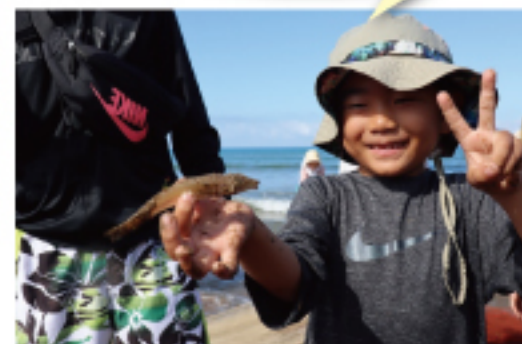
魚が沢山採れました! 大漁(^^)