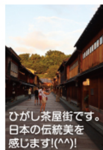
ひがし茶屋街です。日本の伝統美を感じます!(^^)!