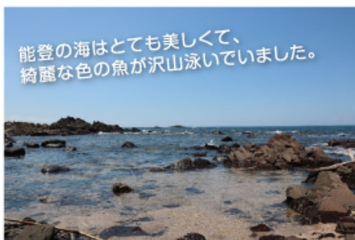
能登の海はとても美しく、綺麗な色の魚が沢山泳いでいました。

10年ぶりの金沢は、町並みが相変わらず美しく、懐かしさや日本の美を感じ感動しました。能登半島でのキャンプは初めてでしたが、海の透明度が高く綺麗な色の魚が沢山泳いでいて、沖縄へ行かなくても南国ムードを味わえる場所でした。B級グルメや美味しい海鮮も沢山あり何度でも行きたい場所の一つになりました。