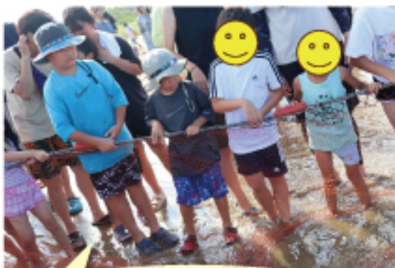
能登のキャンプで地引網体験してきました!