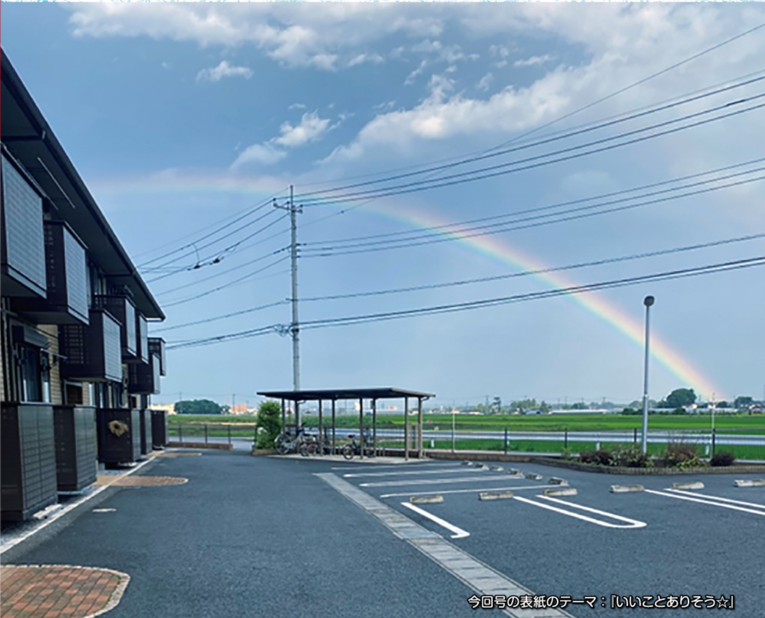
今回号の表紙のテーマ：「いいことありそう☆」